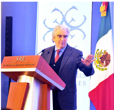
Rafael Tovar y de Teresa.

El secretario de Cultura refrendó el respeto irrestricto a los trabajadores y a las diversas áreas que conforman la institución y realizó un recuento de