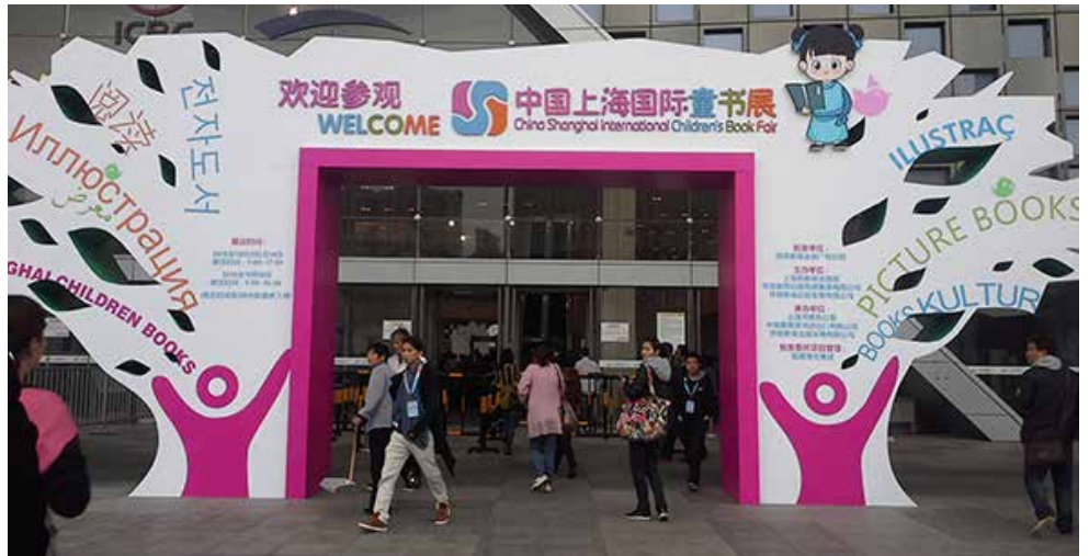
Feria Infantil de Shanghái.

La propuesta inicial era trabajar con el catálogo de libros infantiles y juveniles; pero al ver el interés de estos editores, nos dimos cuenta que hay gran oportunidad de difundir la literatura mexicana en general. Consideramos entonces que esta estrategia para promover los libros para niños y jóvenes funciona para los demás libros, pues les interesan mucho los libros didácticos, tanto para traducir al chino, como para publicar en español.