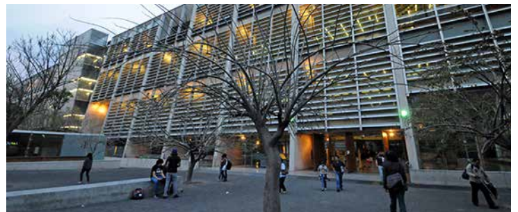
Biblioteca Vasconcelos.

Para dar atención a los usuarios del país las bibliotecas proporcionaron los siguientes servicios básicos: préstamo interno con estantería abierta, préstamo a domicilio, servicios de consulta, orientación a usuarios y actividades de fomento a la lectura.