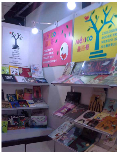
Stand de México en la Feria Infantil de Shanghái.