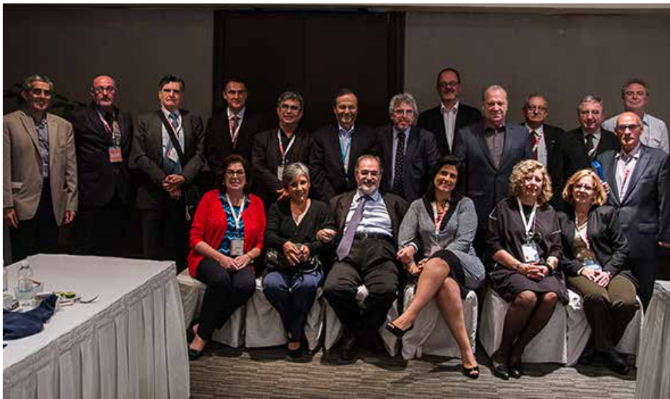
Reunión del GIE en la FIL de Guadalajara.

Entonces, recalcó, así como hay dificultades en el trasiego de libros en los países centroamericanos como Nicaragua, Guatemala, El Salvador y Costa Rica, a nosotros nos pasa con Brasil, Argentina, Bolivia, Chile y Paraguay.