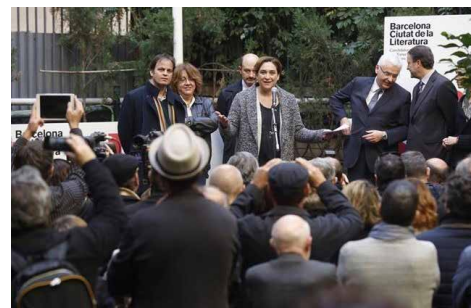
La alcaldesa Colau se dirige a los asistentes a la fiesta de celebración de Barcelona como Ciudad Literaria.

Para la alcaldesa: “en momentos excepcionales como el que estamos viviendo necesitamos más que nunca la cultura, es un derecho fundamental” y ha agregado que la “literatura nos puede ofrecer un apoyo esencial, necesitamos imaginación y poesía”.